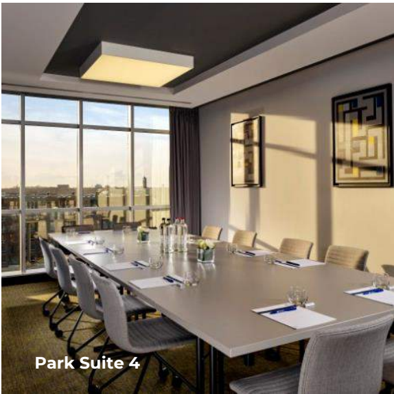
Park Suite 4