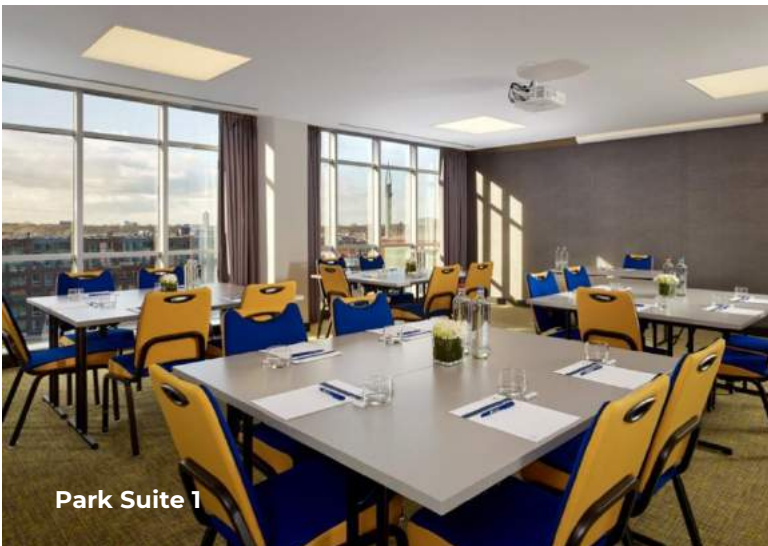
Park Suite 1