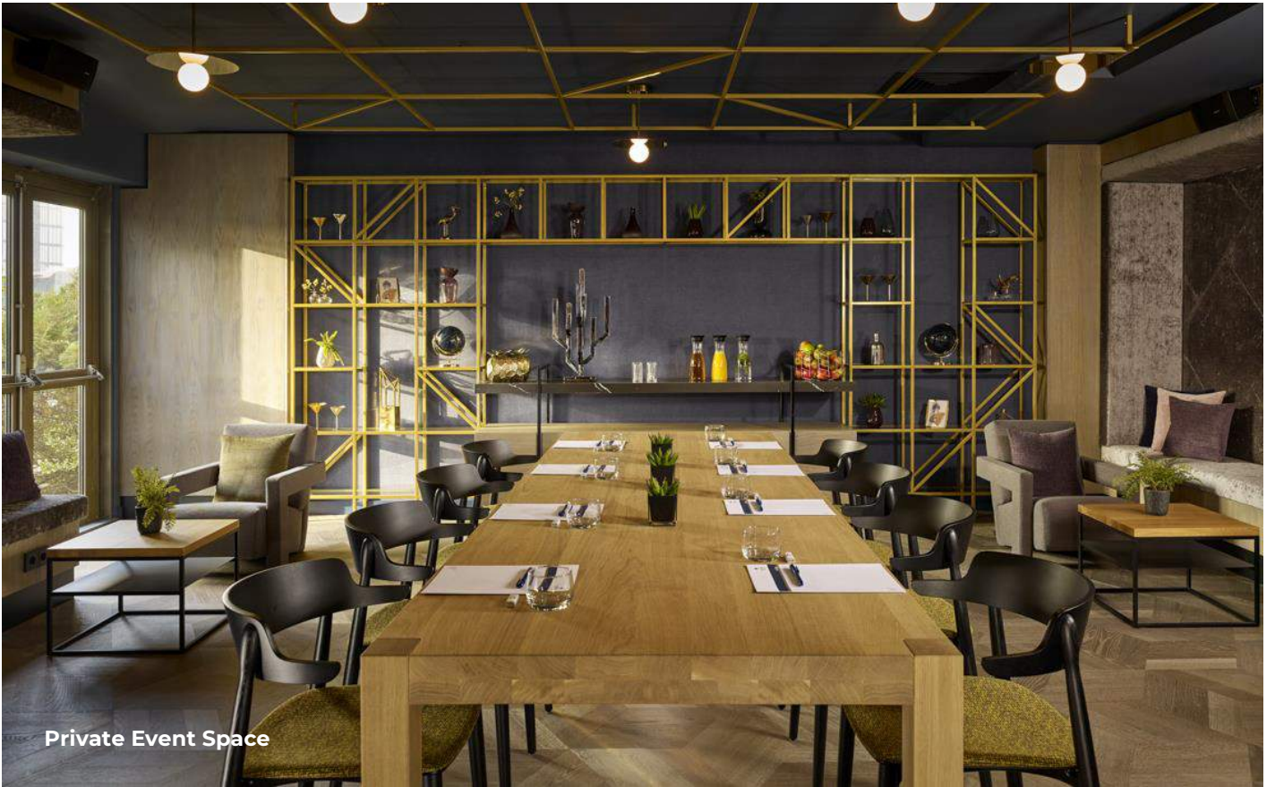
Private Event Space